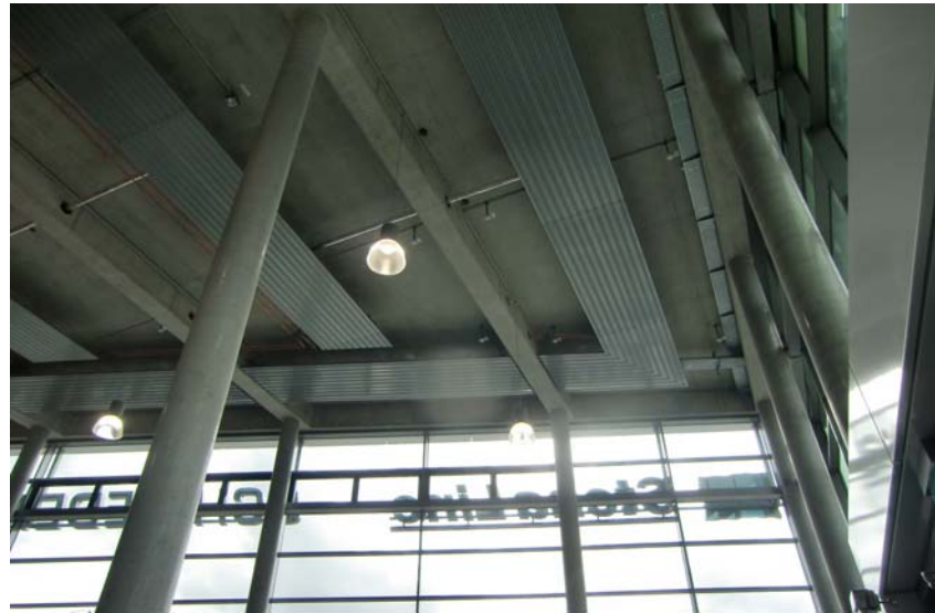
Deckenstrahlheizung und Sichtmontage im Terminal