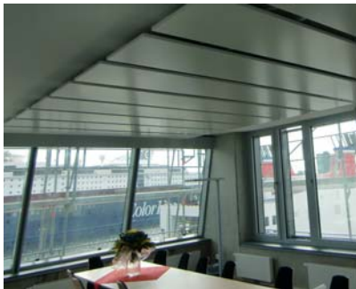
Besprechungsraum mit Deckensegeln

Nachhaltigkeit durch hohe Energieeffizienz