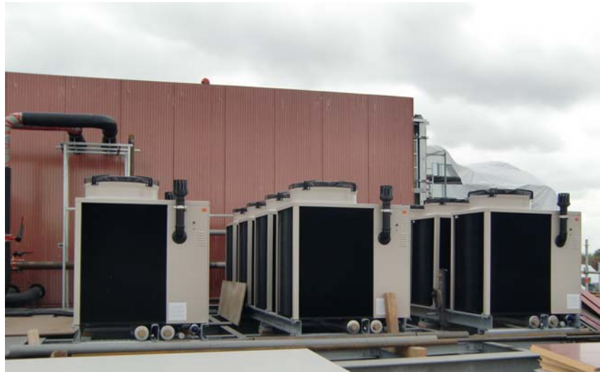
Regenerative Wärmeerzeugung über Gasabsorptionswärmepumpen